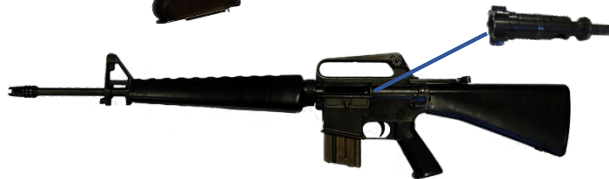
圖 5：擬宣布為槍械的火器元件