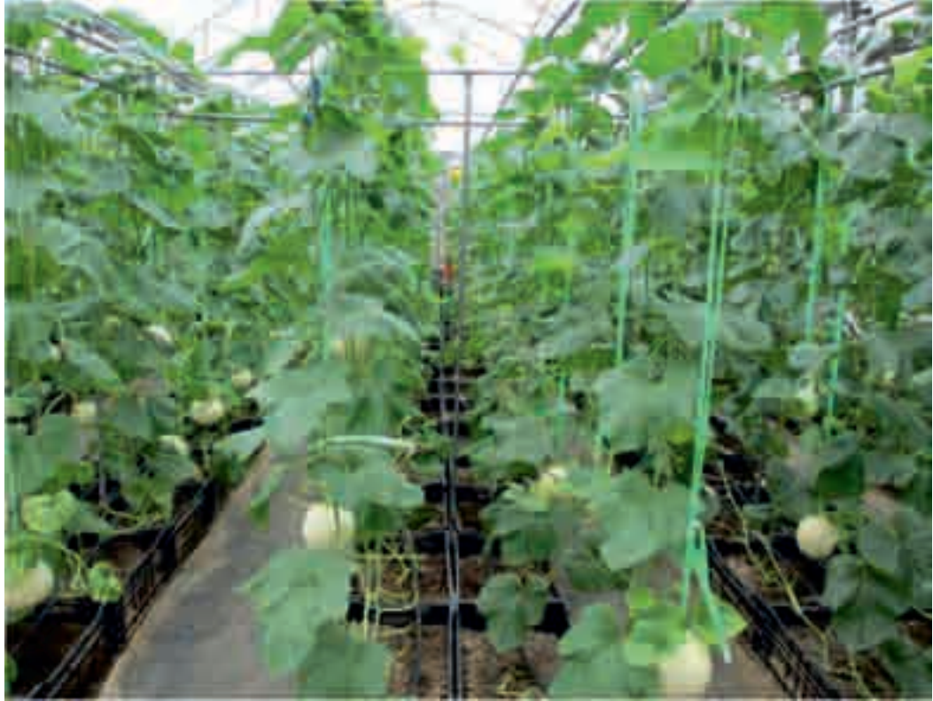
在溫室內栽培高值有機農作物