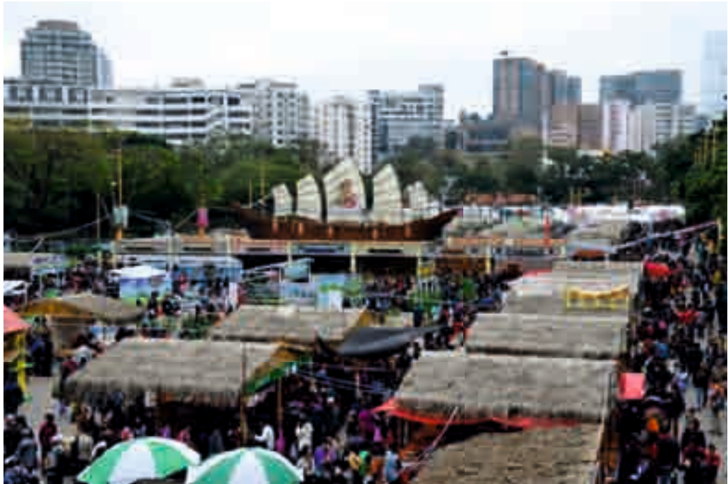
每年一度的本地漁農美食迎春嘉年華推廣本地產品