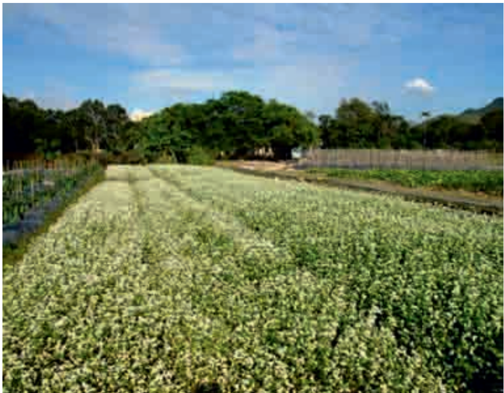
這個有機農場在種植周期中加入栽培蕎麥作為綠肥以改善土質