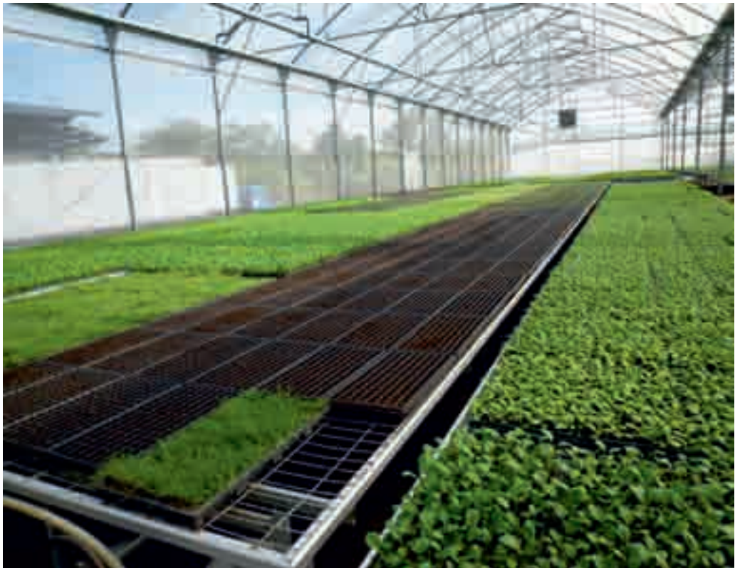
現代化自動播種、集體菜苗生產可提高生產效率