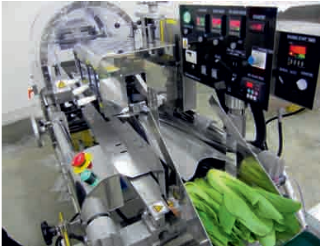
機械包裝蔬菜以打造品牌

4.28 周末農墟及嘉年華亦是農民推銷其產品的有效方法。目前，每年一度的「本地漁農美食迎春嘉年華」及各個周末農墟廣受本地農民和消費者歡迎。通過這些活動，農民可直接與消費者聯繫，節省交易成本。漁護署會繼續探討在更多地區設立更多周末農墟的可行性。