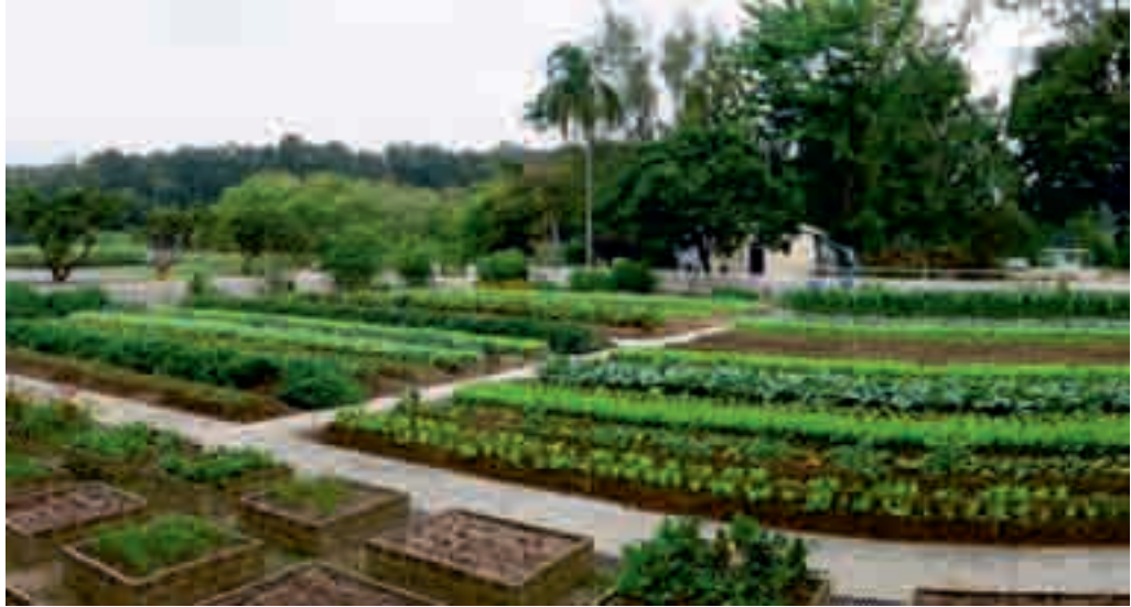
實踐輪作法和綜合式耕作的現代化有機農場