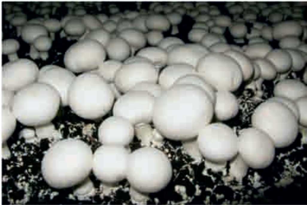
利用現代化方法控制溫度、濕度和光度栽培磨菇