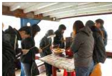
进行简单悼念仪式