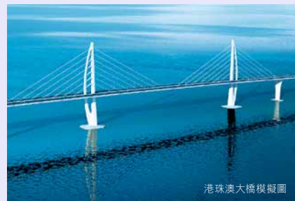
港珠澳大橋模擬圖

港珠澳大橋的29公里長主橋工程已於2009年12月15日展開，香港口岸的填海工程亦已於2011年11月30日